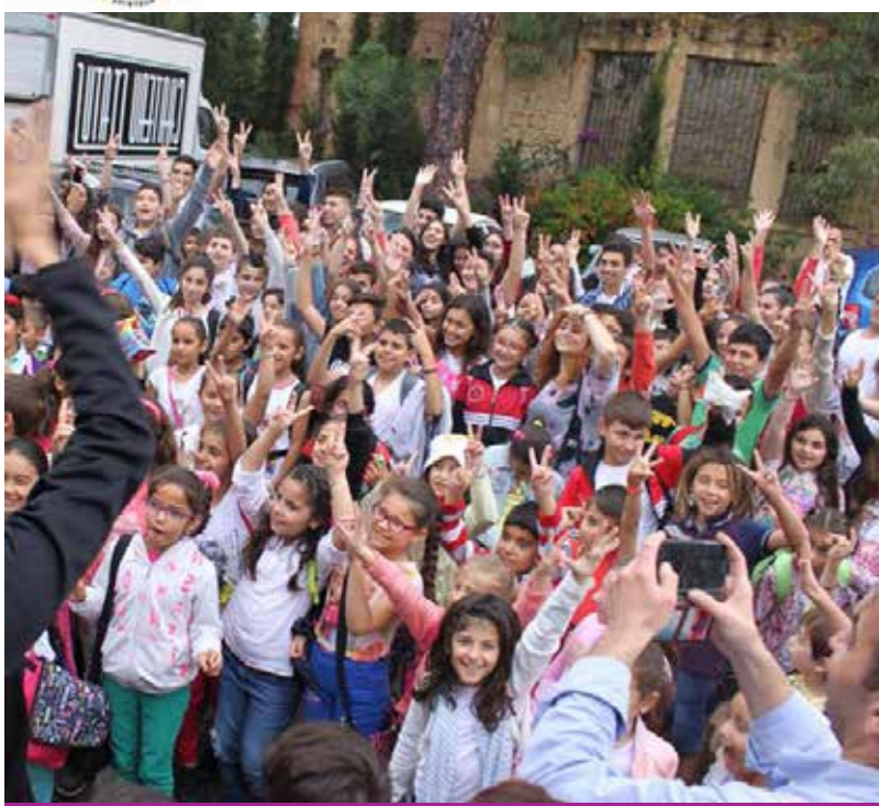
Education for a Culture of Peace, Η4C